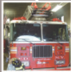
UNA ESTACIÓN DE BOMBEROS