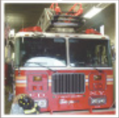
መደበር መጥፋእቲ ሓዊ